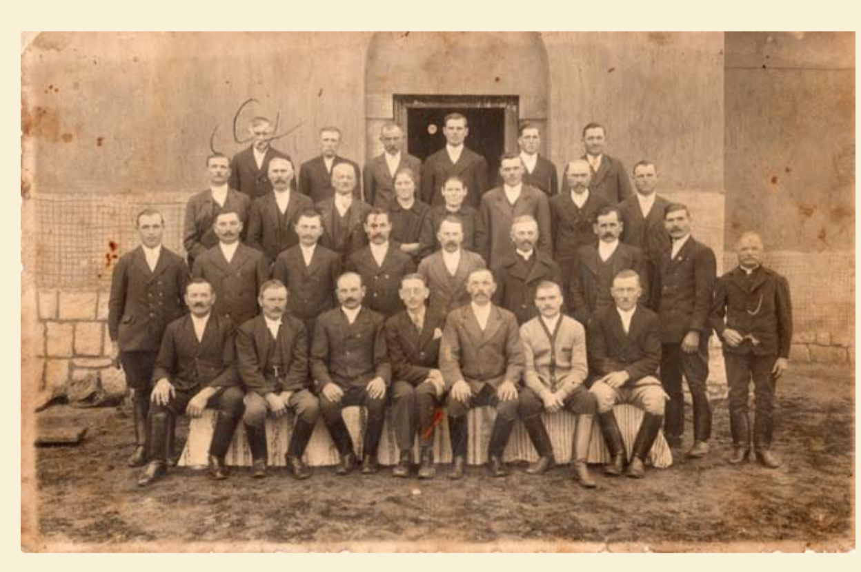
Cigánybokori iskola és az alapító gazdák