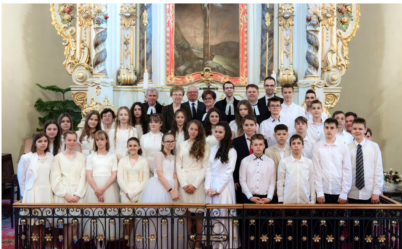
Összép a 2023. május 28-án konfirmált fiatalokról.