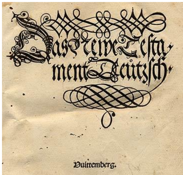
A „Septembertestament” címlapja

Luther német nyelvű Újszövetség-fordításának első kiadása 1522 szeptemberében jött ki a nyomdából, ezért emlegetik így: „Septembertestament”. A fordítást kényszerű wartburgi tartózkodása alatt, 1521 decemberében kezdte el a reformátor, és – elképesztő iramban – 1522 februárjáig, tizenegy hét alatt fejezte be. Ezt azután Melanchthonnal és másokkal együttműködve felülvizsgálták, miután visszatért Wittenbergbe. Körülbelül 3-5000 példányt nyomtattak, és már 1522 decemberére meg kellett jelennie a második kiadásnak. A könyv ára egy/másfél gulden volt, ami egy iskolamester kéthavi fizetésének felelt meg. Mire Luther 1534-ben kiadta a teljes Bibliát, Újszö-