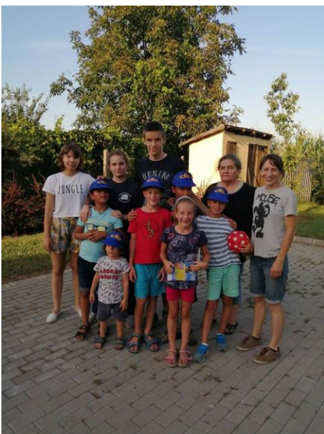
A gyermekklub résztvevői Vargabokorban és Borbányán

Összesen 68 gyermeket érthettünk el az evangélium üzenetével, és két gyermekről tudhatjuk, hogy elfogadta Jézust Megváltójának! Hálásak vagyunk mindazért, amit Isten köztünk és bennünk végzett!