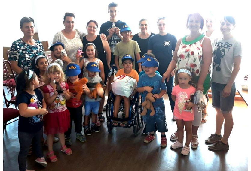
A gyermekklub résztvevői Érpatakon