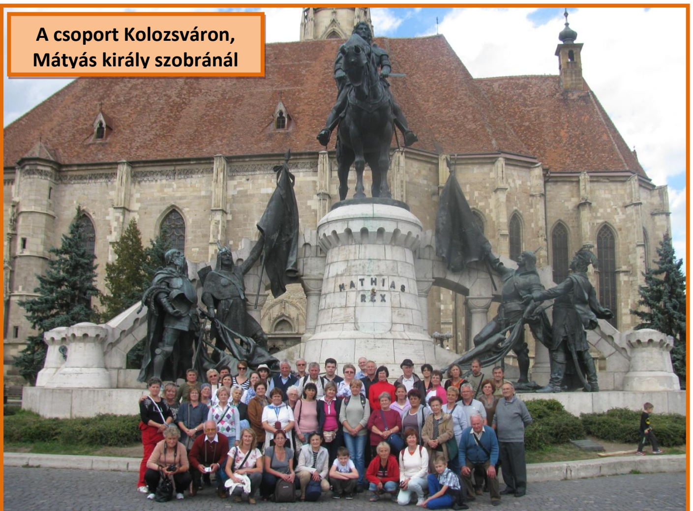
A csoport Kolozsváron, Mátyás király szobránál