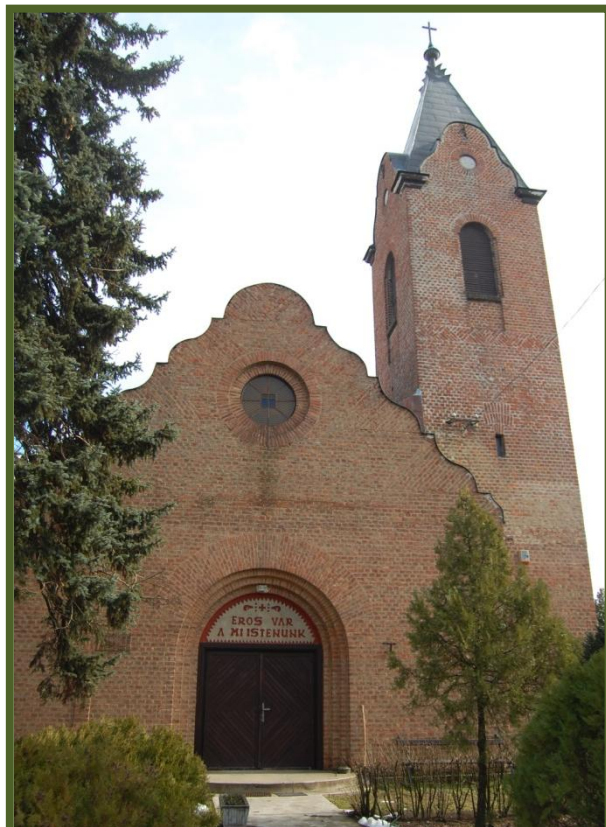
Evangélikus templom, Kálmánháza

Az Istentisztelettel párhuzamosan gyermekórát is tartunk.