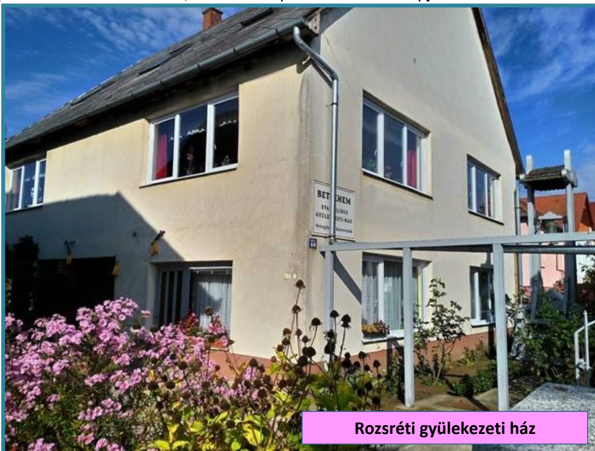
Rozsréti gyülekezeti ház

A hónap 3. vasárnapján 10 30 órakor a református templomban istentisztelet.