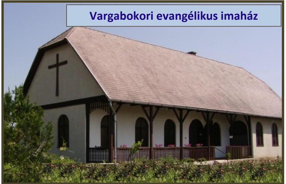
Vargabokori evangélikus imaház

Évente kétszer - Húsvétra és Karácsonyra - kiadjuk az Ébresztő című körzeti körlevelünket: a bevezető igemagyarázat mellett tájékoztatót adunk benne az aktuális híreinkről, feladatainkról.